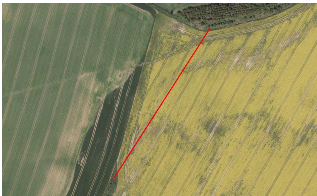
Figur 1.1: Rørlægning AAL-2013 iht. Naturstyrelsens MiljøGIS.