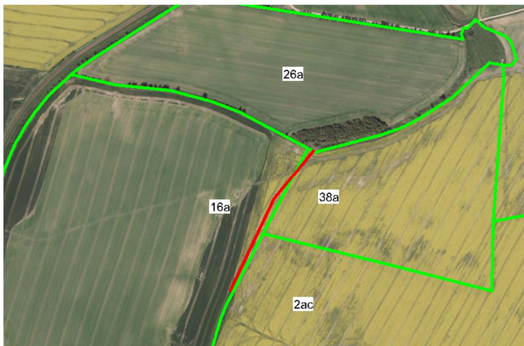
Figur 7.1: Matrikulære forhold for projektområdet.