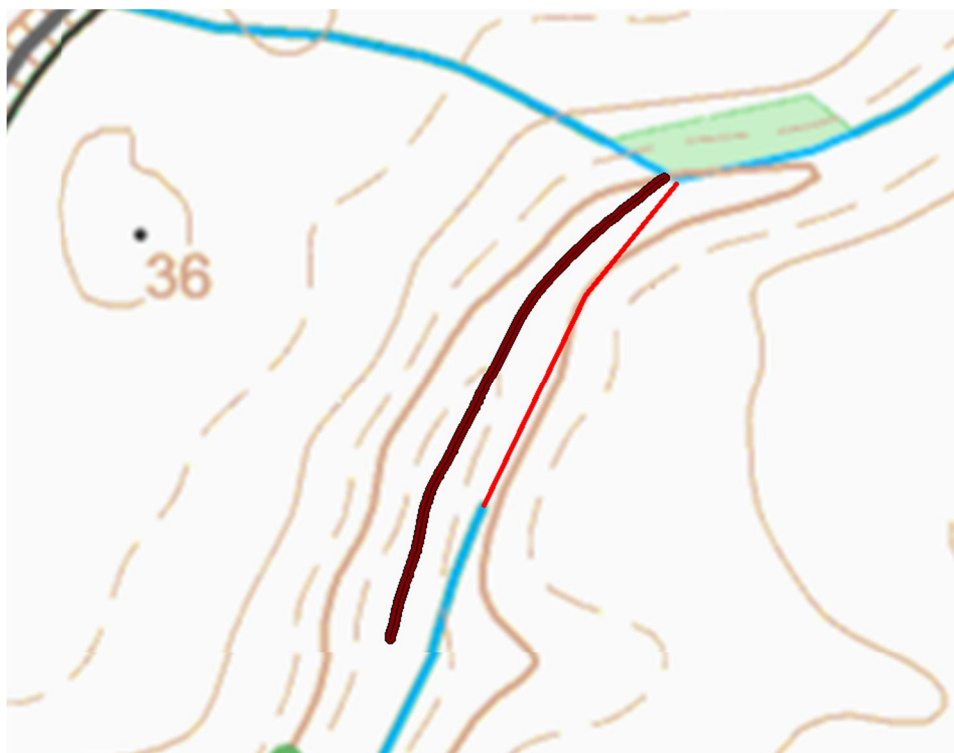
Figur 5.2. Brun streg er forløb af laveste terræn og rød streg er det forventede tracé for rørlægningen.